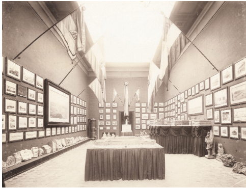
A Kuzsinszky-féle múzeum, az 1907-es tárlat egyik terme

letek és a gyakorlat által talált és igazolt eredményeket.” 23 A mai magyar forrongó, átalakuló múzeumi világban nem árt emlékezni a száz éves Fővárosi Múzeumra.